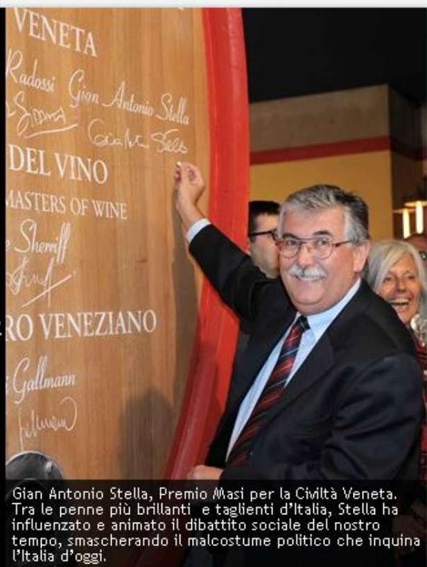
Gian Antonio Stella, Premio Masi per la Civiltà Veneta. Tra le penne più brillanti e taglienti d'Italia, Stella ha influenzato e animato il dibattito sociale del nostro tempo, smascherando il malcostume politico che inquina l'Italia d'oggi.